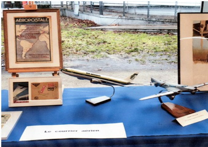
Le courrier aérien