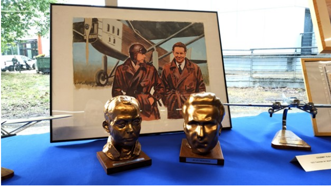
Aéropostale : Bustes Saint Exupéry et Mermoz