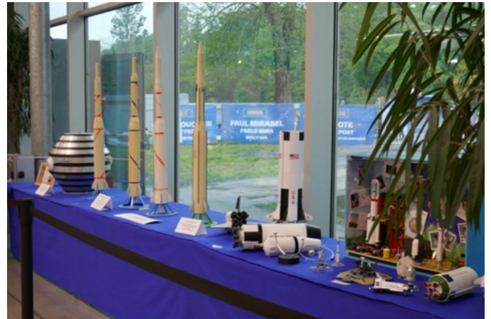
Fusées série Les « pierres précieuses » et Apollo