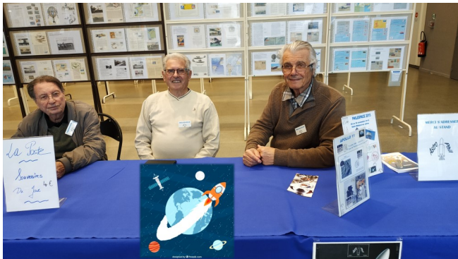
Des membres du CA en renfort sur le stand de La Poste