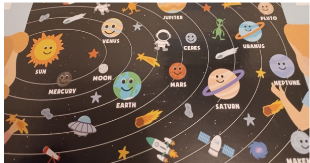
Un espace ludique pour les enfants : jeux , concours dessins récompensés par livres, gadgets ainsi que produits philatéliques