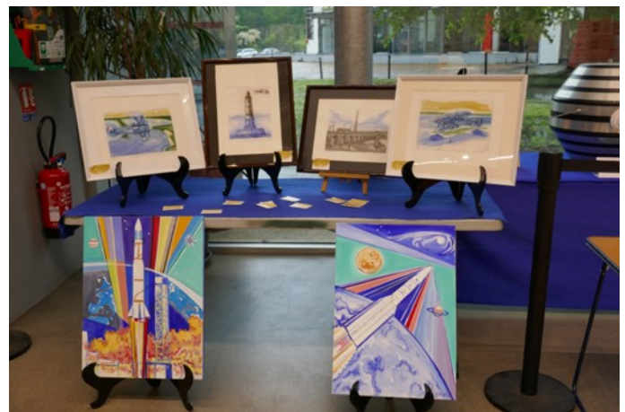
Peintures amateur espace