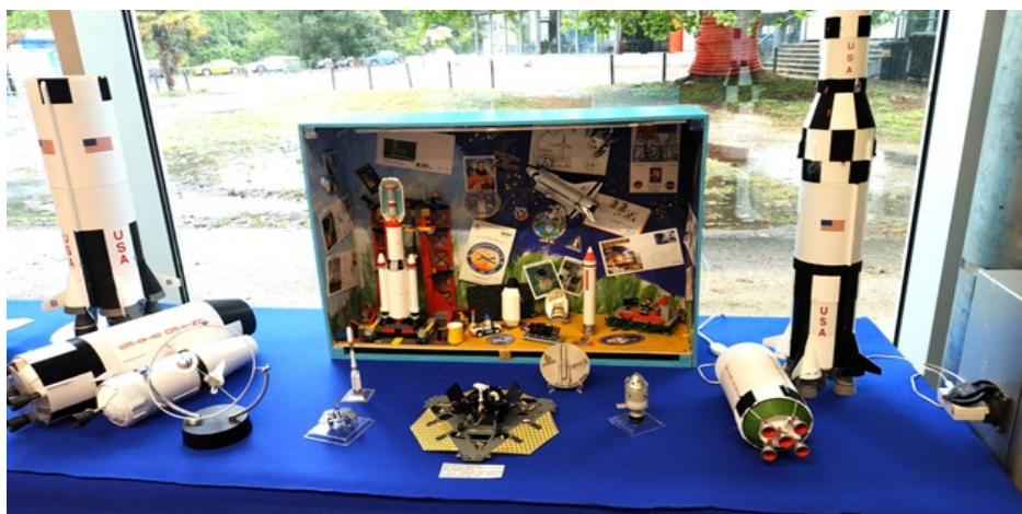
Maquette base lancement ariane (lego) Apollo - navette US